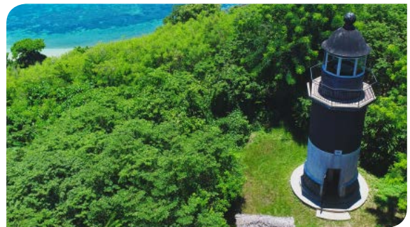
NOSY BE | P.15-16