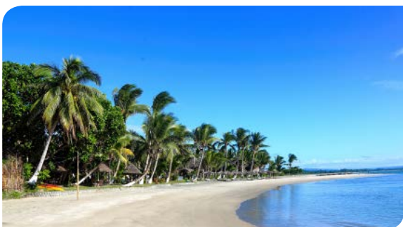
TAMATAVE | P.21-22