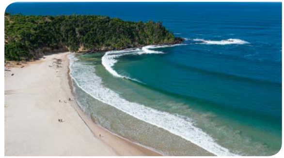
FORT DAUPHIN | P.7-8