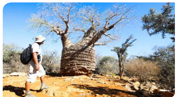
TULEAR | P.23-24