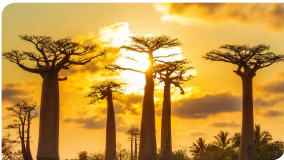
MORONDAVA | P.13-14