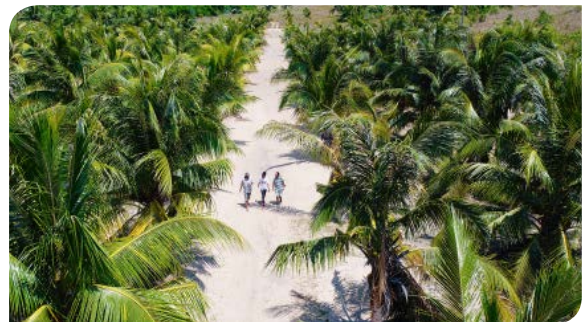
SAMBAVA (SAVA) | P.19-20