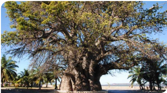
MAJUNGA | P.9-10