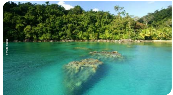
MAROANTSETRA | P.11-12